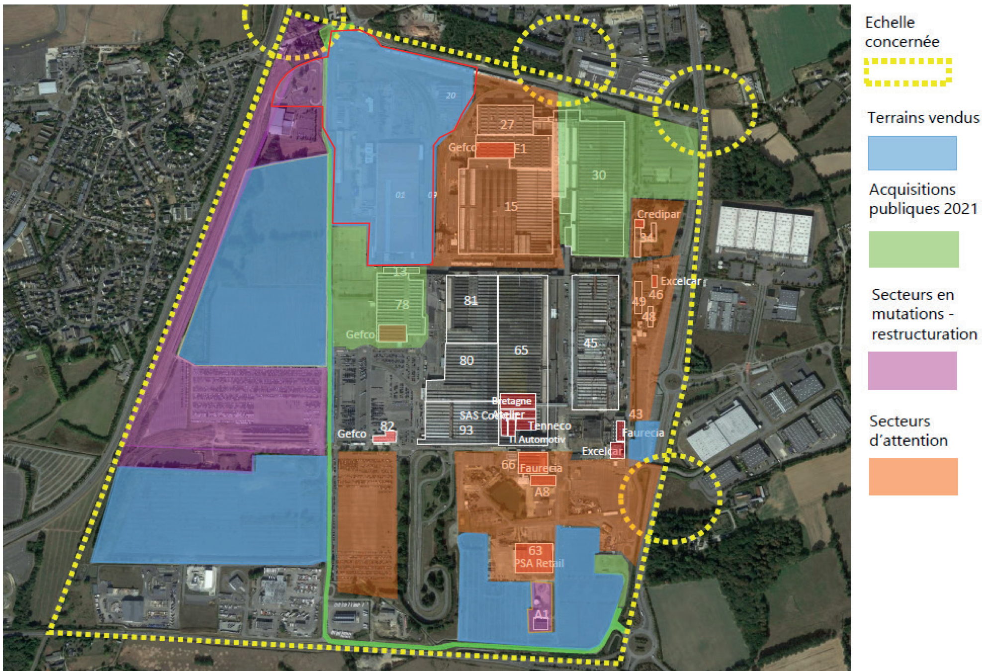
Figure 72 : Mandat d'études pré-opérationnelles (RM et Terriores) - OAP La Janais